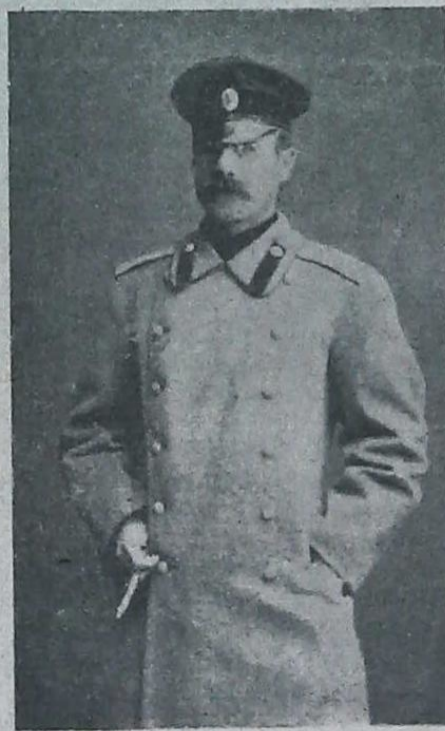
Ген. А. М. Калединъ (въ молодости).