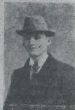
Жертва гражданской войны.

Но, повторяю, мы были разбросаны и лишь с большим трудом поддерживали связь только с стоявшими по соседству батальонами.