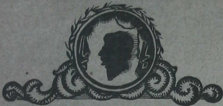
Рис. Константина Аладжамова.