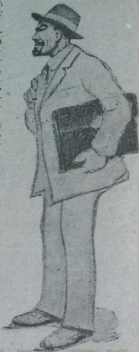
Ленинъ идетъ трамвая. (Зарисовка съ натуры петроградскаго художника Синаева лѣтомъ прошлаго года для журнала „Трудомысль“.)