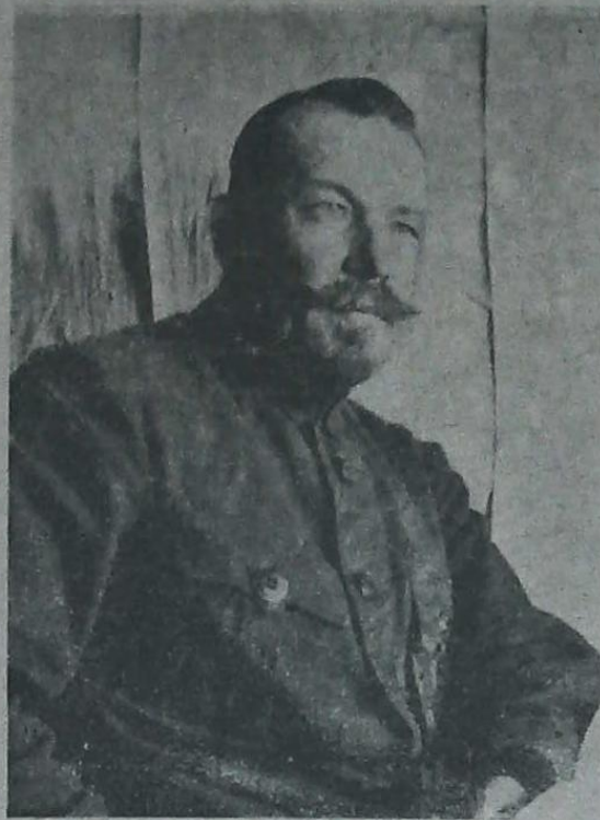
Ген. В. Г. Болдыревъ, «сибирскій диктаторъ»—главнокомандующій фронтомъ Учредительнаго Собранія, членъ Уфимской директоріи.

Въ 16-мъ году онъ занялъ сперва постъ генераль-квартирмейстера сѣвернаго фронта, а затѣмъ получилъ 43-й армейскій корпусъ.