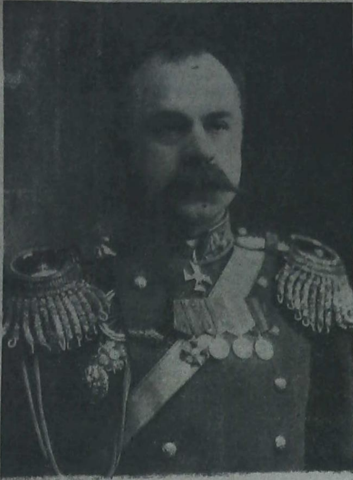
Ген. А. М. Калединъ (въ первые годы службы въ Новочеркасскѣ).

бинцева, что въ 2 часа ночи прибудетъ въ Усть-Хоперскую хорошо вооруженная сотня большевцевъ и каледицевъ. Настроение стало приподниматься. Сотня прибыла во-время, и у нея на полтора человека было 40 винтовокъ; это считалось великолѣпнымъ вооружениемъ. Къ утру прибыла другая сотня; эта была вооружена слабѣе. На площади былъ отслуженъ молебенъ. Теперь бояться было нечего. Тѣмъ болѣе, что стало извѣстно о возвращеніи обратно въ Усть-Медвѣдицу карательнаго отряда, который прошелъ 5 верстъ, а дальше идти убоился. А Мироновъ на митингѣ въ Усть-Медвѣдицѣ сказалъ: