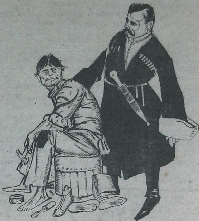
Рис. Леонида Кудина.

— Армія отступать будетъ — подметни подлиннешъ