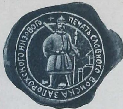
Печать славнаго Войска Запорожскаго Низоваго.

собраніе постановило обратиться ко всѣм руководителям казачьей прессы с настойчивой просьбой прекратить взаимныя нападки и вести полемику в болѣе достойных тонах.