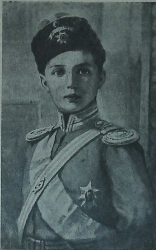
Е. И. В. Наслѣдник Цесаревич Алексѣй Николаевич, Атаман всѣх Казачьих Войск, в формѣ своего шефскаго, Л.-Гв. Атаманскаго полка.

Вѣчный шеф полка (с 1904 г. генерал Ермолов (Алексій Петрович), герой Отечественной войны и покоренія Кавказа, родился в 1772 г. В 19 лѣтъ — капитан, 21 года — кавалер Георгія 4-й ст. (война с Польшей), при императорѣ Павлѣ — опала (сослан в Калугу вмѣстѣ с опальным — подозрѣніе в сепаратизмѣ — Платовым). За кампанію 1805-7 г.г. — Георгій 3-ей ст. В 1812 г. — начальник главнаго штаба 1-ой арміи, под Бородиным лично вел штыковую контр-атаку на захвативших батарею Раевского французов. В 1813-14 г.г. начальник всей артиллеріи и отдѣльных отрядов — Георгій 2-ой ст. В 1816 г. — командир Грузинскаго корпуса и посол в Персію. Пре-