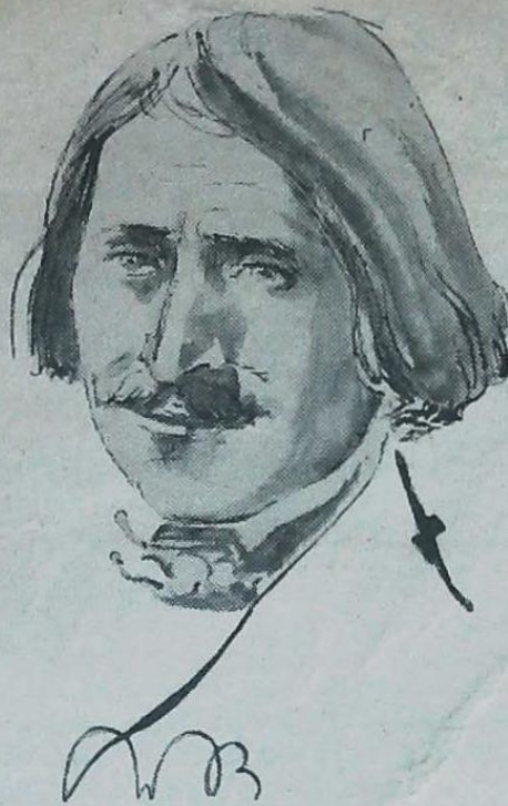
Портрет работы В. Барсова.